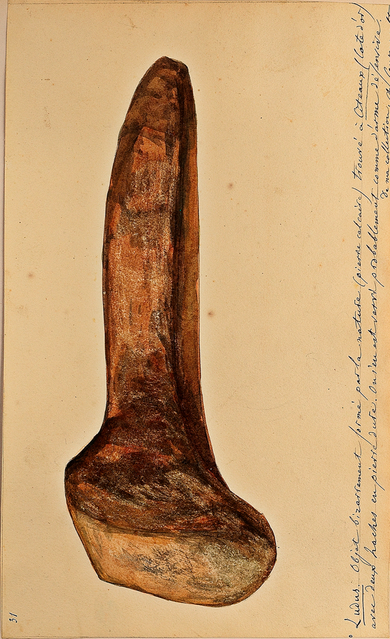
Ludus. Objet bizarrement formé par la nature (pierre calcaire) trouvée à Cîteaux (Côte d'Or) avec deux haches en pierre de côté. On s'en est servi probablement comme d'arme de service. De ma collection, Ch. Courmoultz