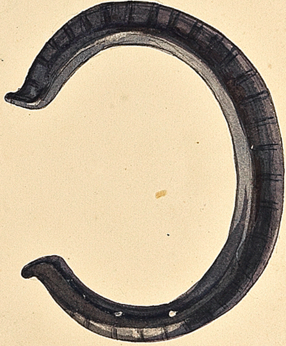
Bibliothèque de Nancy. Bracelet en bronze gris.