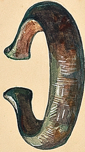
Bracelet en cuivre rouge. Trouvé aux environs de Toul. De ma collection. Ch. Commaux