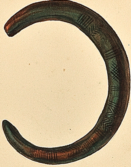
Bracelet trouvé dans le lac de Genève. Milieu de l'âge du bronze. H. Goussier à Genève. Ch. Commaux