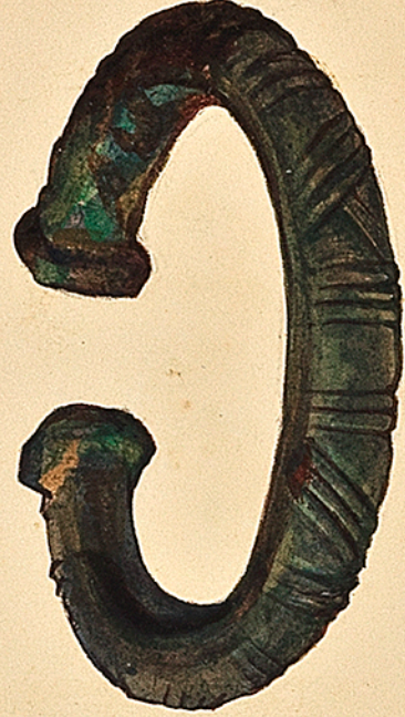
Bracelet Gaulois en cuivre rouge. 1 re époque subromaine. Environs de Toul. De ma collection. Ch. Commaux