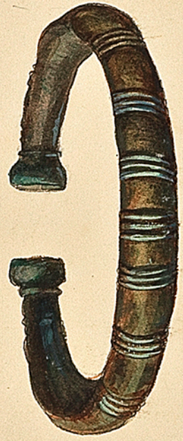
Bracelet Gaulois en cuivre rouge 1 re époque du bronze. Environs de Toul. De ma collection. Ch. Commaux