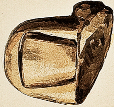
Musée historique lorrain. Orteil en marbre blanc, trouvé à Tarquinopol . Ce doigt n'a pu appartenir à une statue. Il semble plutôt servir d'apote. Le doigt ou doigt est poli et n'a pu servir à tracer. Ch. Cuvigny.