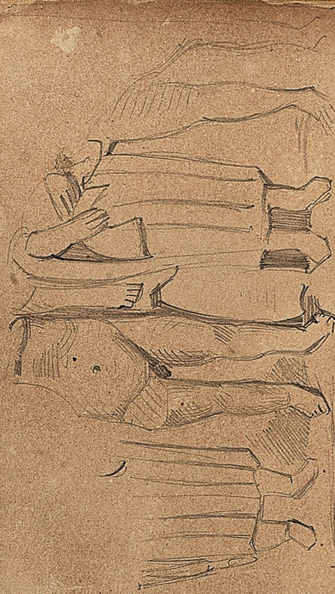
Musée d'Espinal. Fragment de sculpture gallo-romaine trouvée à la Hutte . ( Ve siècle ) Ch. Cuvigny