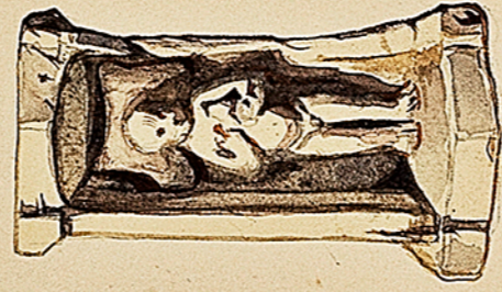
1. Bas-relief d'un enfant gallo-romain. L'enfant, couché, sur la tête soutenu par un chéillon. Il tient une perle. 2. Profil du bas-relief.