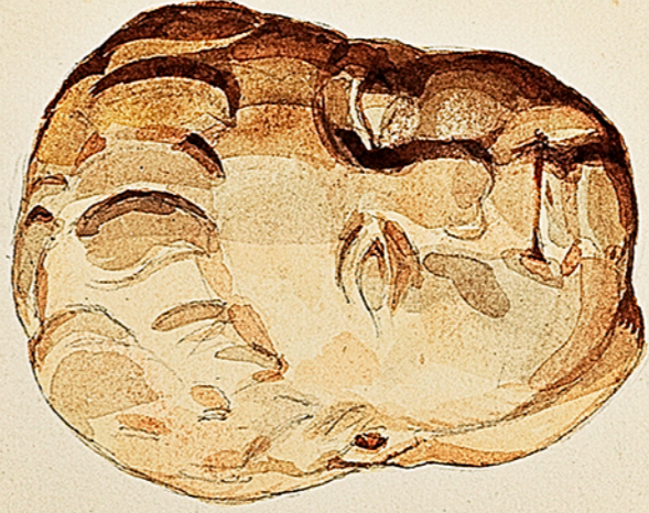
Musée historique lorrain. Petite tête d'enfant en marbre blanc, trouvée en 1866 à Tarquinopol .