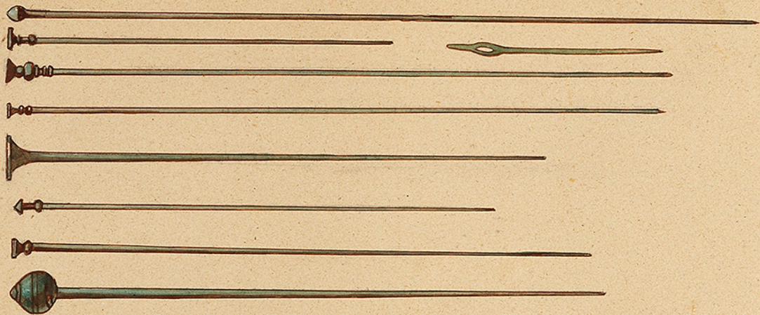
Épingles en bronze