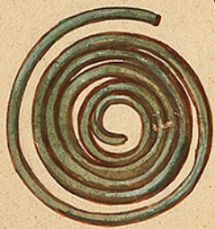
Fil de bronze torsé en spirale