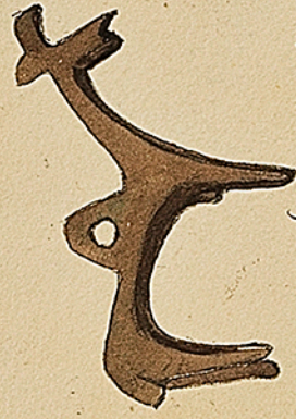
Bibliothèque de Strasbourg. Amulette.