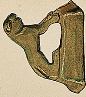
Petit Lince de bronze. Trouvé à Langres.