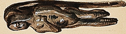
Agde. Agde Gallo-Romaine. Venus cristall. de la Gauloise. De ma Collection. Ch. G. Collection