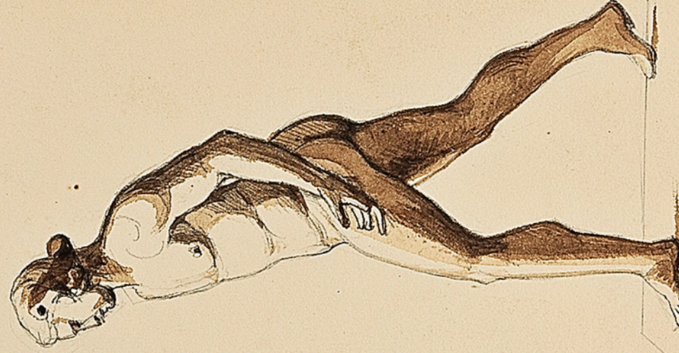
Bibliothèque de Nancy. Apollon. Le bras droit tient une têtu. mais il est brisé. Statuette d'un très bon style. Trouvée à la Nouveville. Nancy.