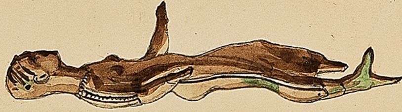
Statuette de bronze. Est ancienne représentant une femme gauloise. Elle semble porter un collier au col. Le bas de sa robe est taillé à pointes comme dans les statues de femme trouvées à Langres.