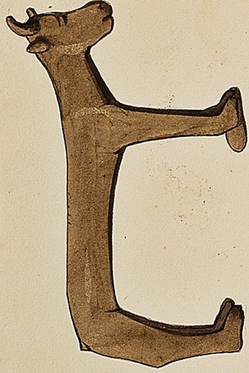
Bancif. Veste à amulette gauloise.