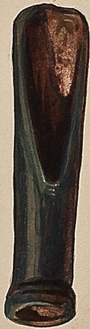
Musée d'Epinal. Gouze de sculpteur.