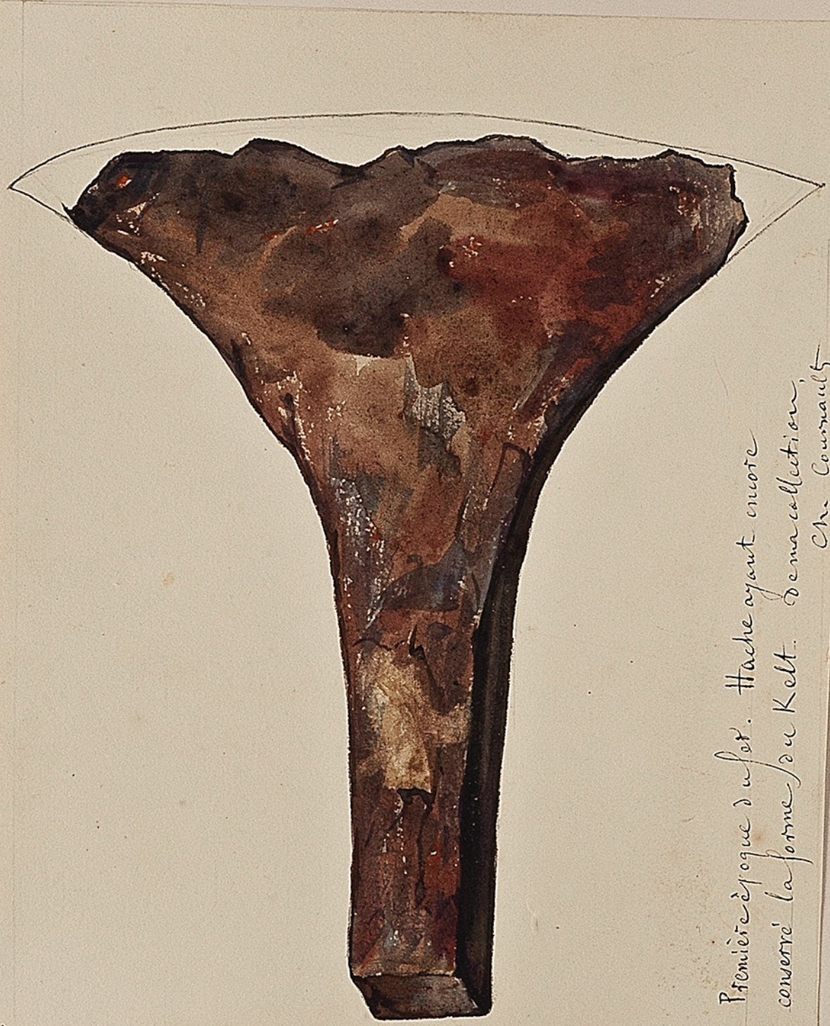
Première époque d'usot. Hache ayant encore conservé la forme du Kelt. De ma collection. Ch. Commauld.