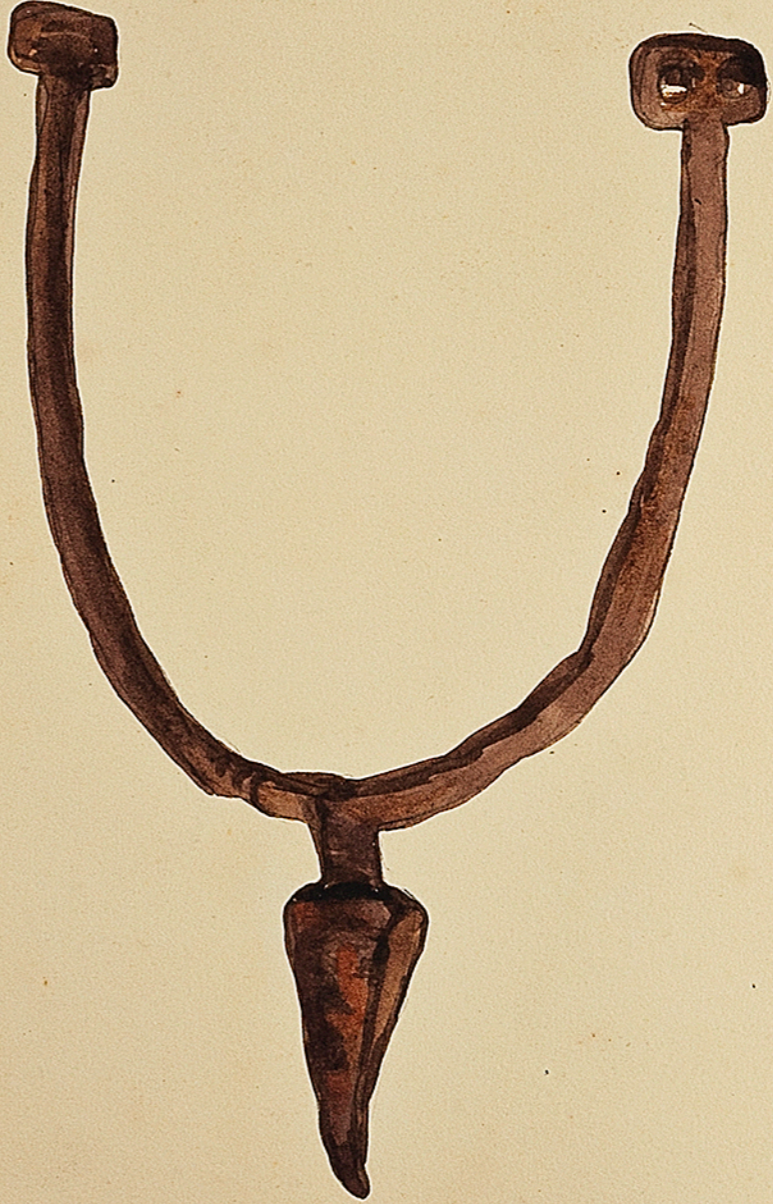
Epouze Gallo-Romaine (?) trouvée à Nancy. Deme collection M. Talli. C'est regardé cette forme comme la plus ancienne. Tophum de Ch. Courmoult p. 161. Elle est représentée postérieurement à celle de 212.