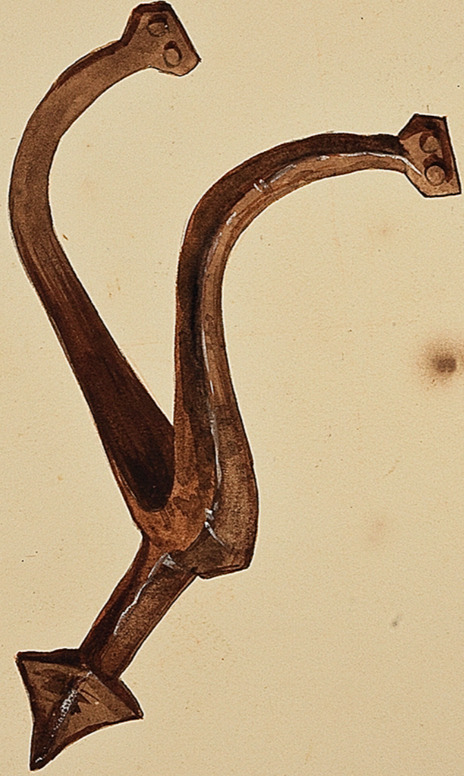
Epouze Gallo-Romaine trouvée à Langfès. Deme collection Ch. Courmoult