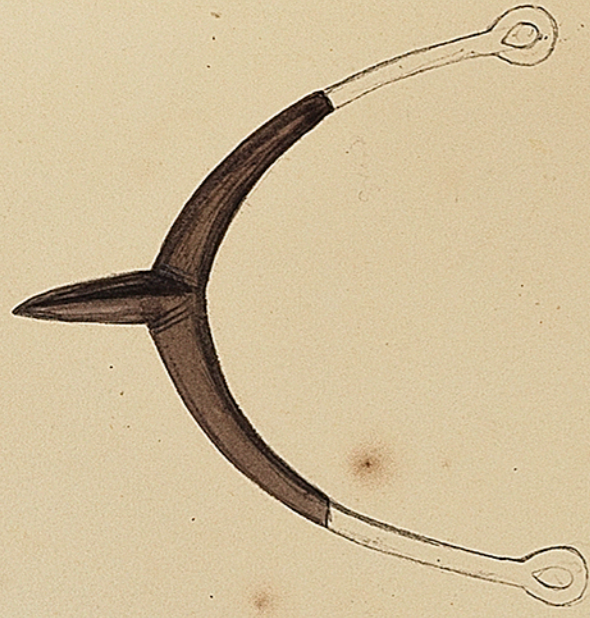
Musée d'Espinal. Epouze (colcat) bronze. Trouvé à Métel invisible ou nommée au sanglier.