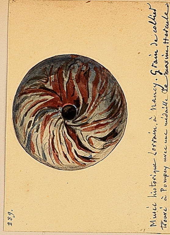
Musée Lorrain. Nancy. Grains de collier en pierre tendre. Ch. Ch.