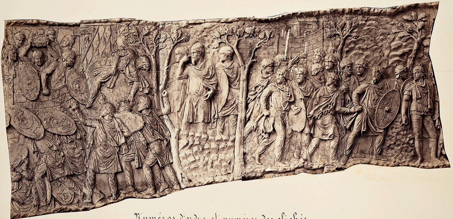
Numéros d'ordre et numéros des clichés.