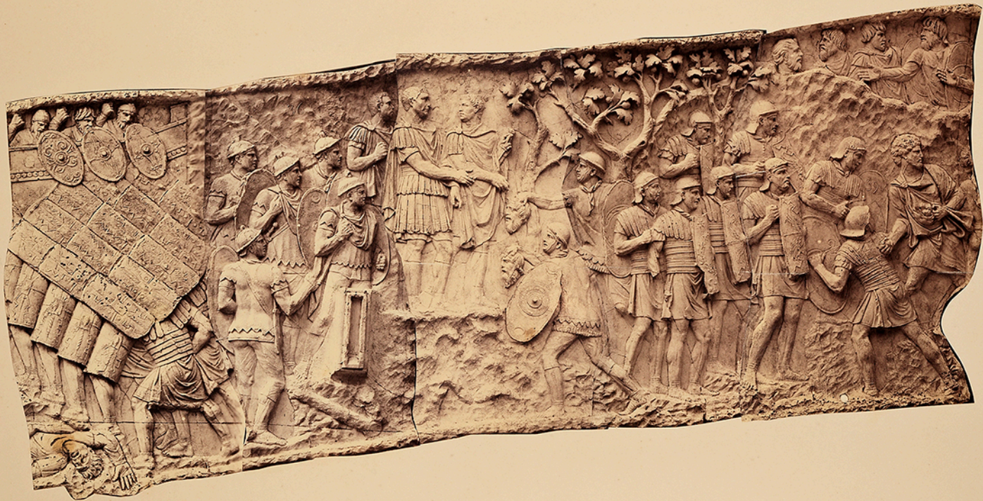
Numéros d'ordre et numéros des clichés.