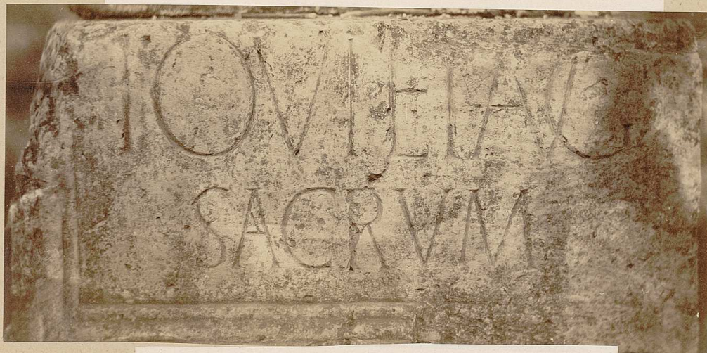
Inscription d'une pierre déposée à la Préfecture de Mâcon (comme hier)

Don de la Commission de la topographie de Gaulle.