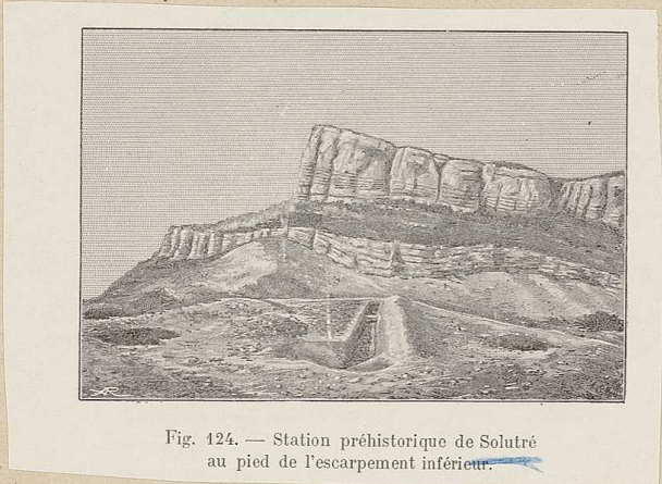
Fig. 124. — Station préhistorique de Solutrèe au pied de l'escarpement inférieur.

Sculpture en plâtre, de la station de Solutrèe, collection de Peuvy Envoyé à Mr. G. de Mortillet par Mr. de Peuvy le 27 novembre 1887