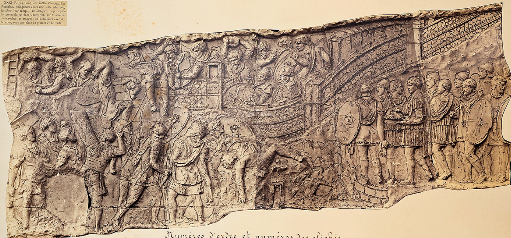
Numéros d'ordre et numéros des clichés.

XXXI (F. 144-146.) Une mêlée s'engage. Les Romains, vainqueurs après une lutte acharnée, forment leur camp. — Ils attaquent la principale forteresse du roi «Iac», construite sur le sommet d'un rocher, et essaient de l'escalader avec des échelles, sous une pluie de pierres et de traits.