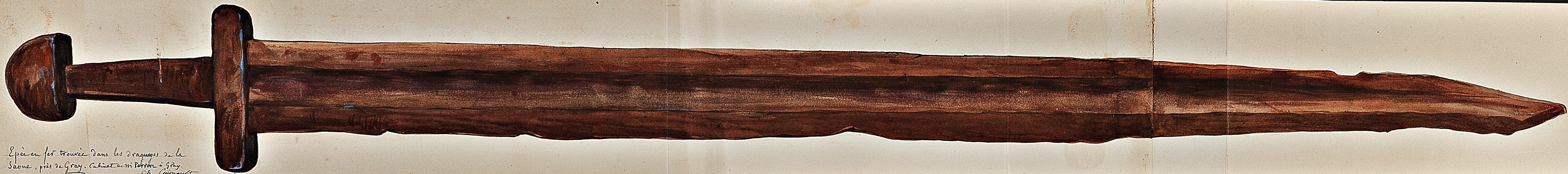
Épée en fer trouvée dans les débris de la Saône, près de Gray. Cabinet de M. Perrot à Gray. Ch. Courmoult