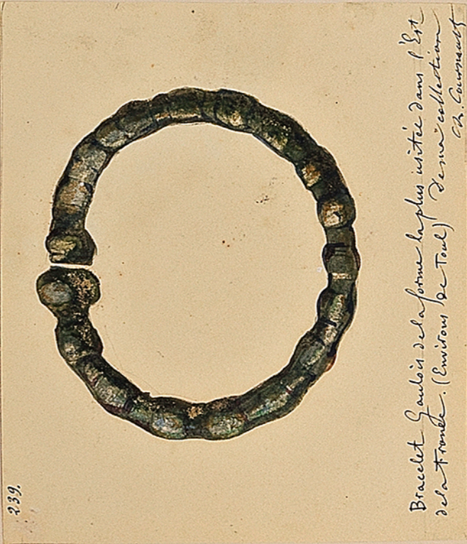
Bracelet Gaulois de la forme la plus usitée dans l'Est de la France (environs de Toul). De ma collection. Ch. Guineault