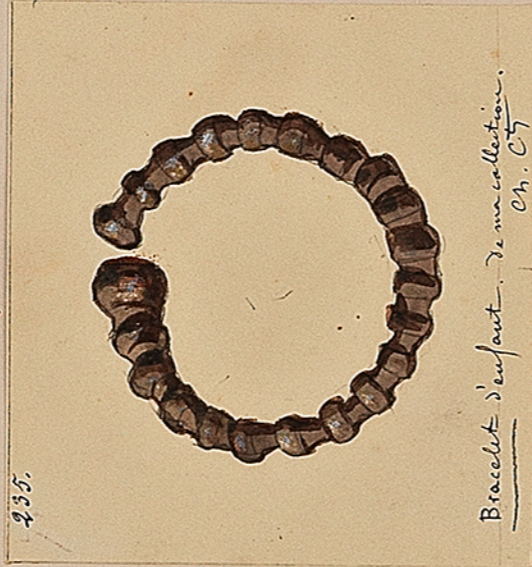
Bracelet d'enfant. De ma collection. Ch. C.T.