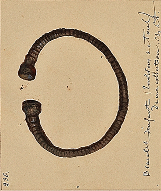
Bracelet d'enfant (environs de Toul). De ma collection. Ch. C.T.