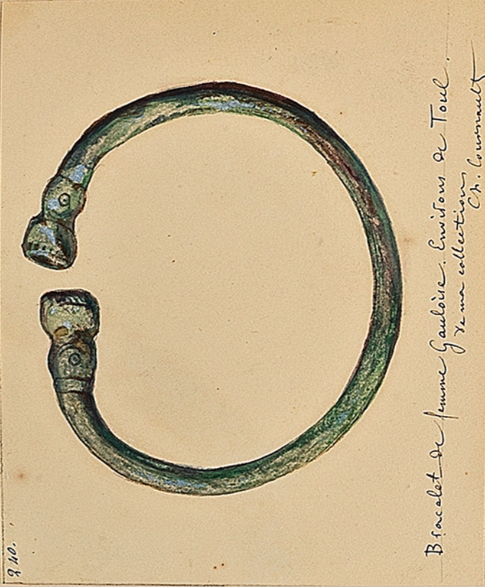
Bracelet de femme Gaulois. Environs de Toul. De ma collection. Ch. Guineault