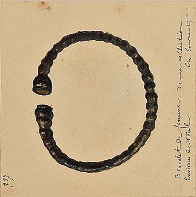
Bracelet de femme, de ma collection. Environs de Toul. Ch. Guineault