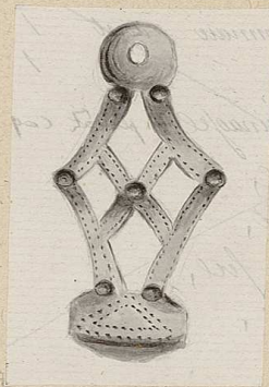
Fibule trouvée dans un jardin voisin du lieu dit Les Croquets, grandeur réelle. L. Cousin, Don de la Commission des Gaules, 1862.