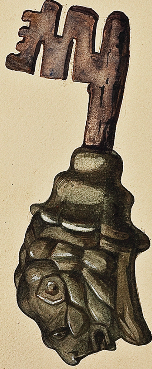
Musée historique Lorrain, à Nancy. Clé antique trouvée à Sion. Il y a plusieurs clés semblables dans le musée de l'Est. Ch. Courmoult

On trouve, assez souvent dans l'est de l'Alsace (cf. pl. 12 fig. 12.) des clefs de ce genre en bronze.