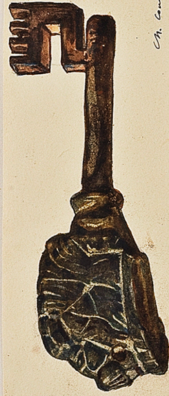
Ch. Courmoult Clé du même genre que la précédente. Environs de Nancy.