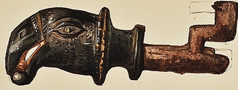
Musée historique Lorrain, à Nancy. Clé Gallo-Romaine. Ch. Courmoult