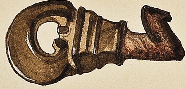
Collection de M re Beaupré Clé Gallo-Romaine Fer et tête de bronze.