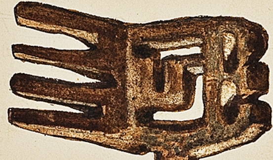
De ma collection. Clé Gallo-Romaine trouvée à Plombières. Bronze. Ch. Courmoult Cabinet de M re Beaupré, conservé à Nancy. 2. Clé Gallo-Romaine trouvée à Langres. Passage de la forme de la clé Gauloise à la forme de la clé Romaine (Fer).