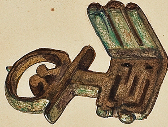
Clé Gallo-Romaine en cuivre rouge. On trouve beaucoup de clés de cette forme analogue dans tout l'Est. Tout. De ma collection Ch. Courmoult