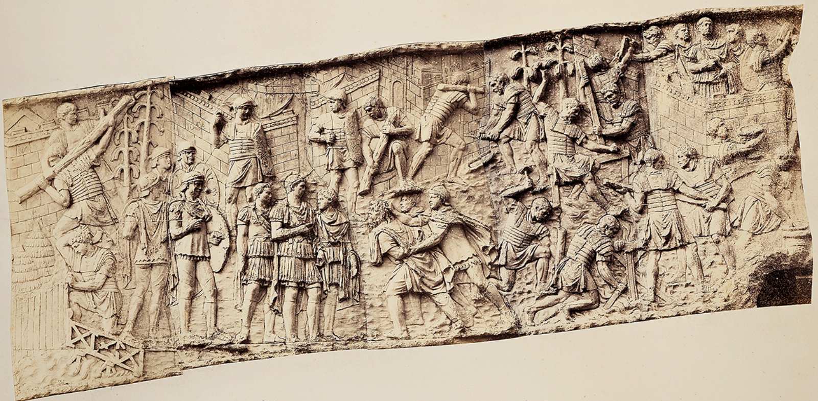
Numéros d'ordre et numéros des clichés.