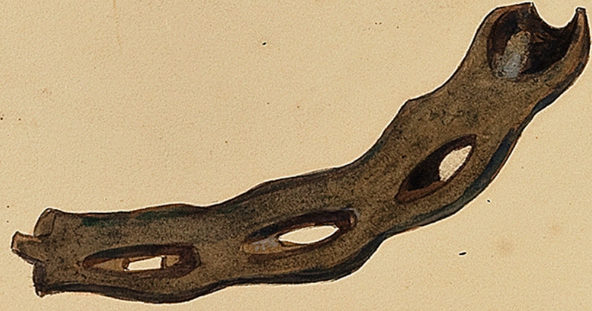
Musee de Delancon. Fer de cheval en fer femme, trouve dans les fondations des aqueducs, en 1850. Travail Gaulois ancien. Ch. Commauld