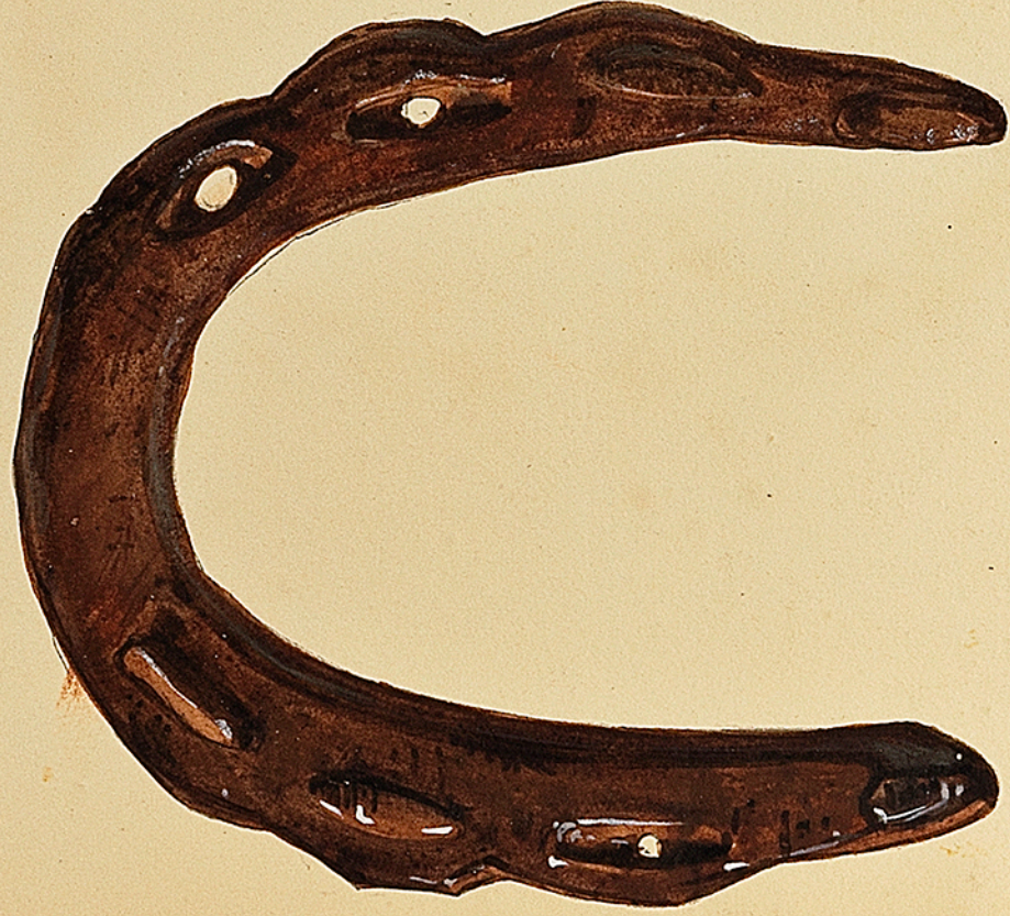
Musee Lorrain à Nancy. Fer de cheval Gallo-Romaine trouve aux environs de Frouard (meurthe) Les fers Gaulois et Gallo-Romains se distinguent par des retampures de forme ovales, qui sont plus allongés qu'à une époque posterieure.