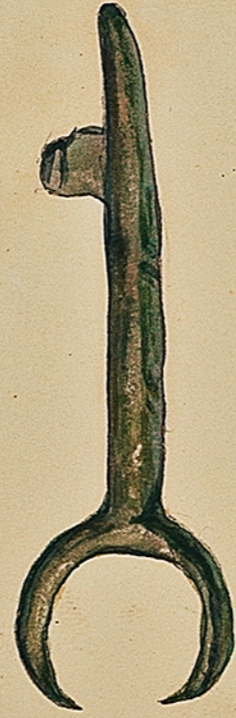
Clé Gauloise en bronze l'âge De ma collection. Ch. Cournaud Toul.