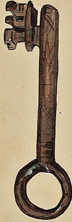
Clé Gauloise en bronze De ma collection. Ch. Cournaud Toul.