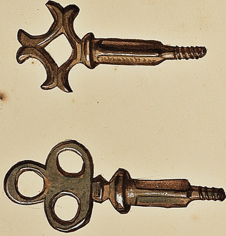
Clés antiques probablement à brat des loges. (Nouveau) De ma collection. Toul. Ch. Cournaud