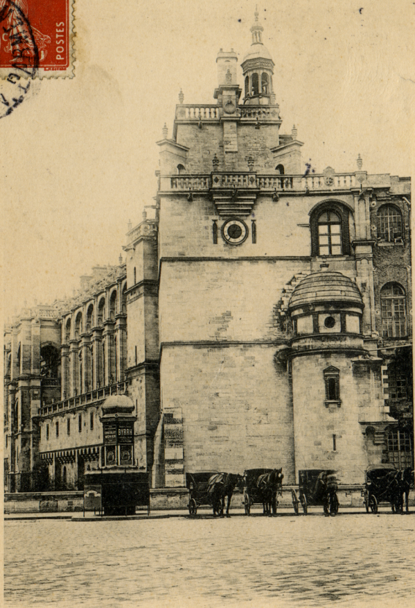
SAINTE-GERMAIN-EN-LAYE — LE CHATEAU