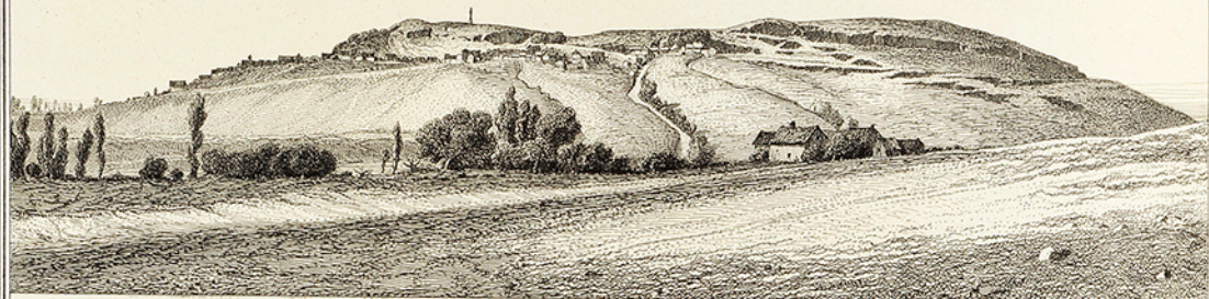
Vue prise de la pointe du Mont Penneville