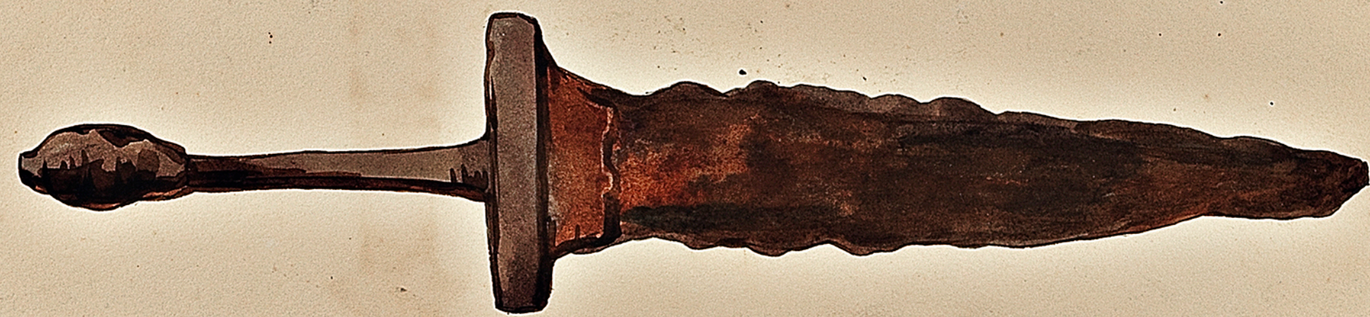
Poignard dont la poignée est tout à fait semblable à celle de l'épée du Gaulois du Donon. Trouvé à Grand.