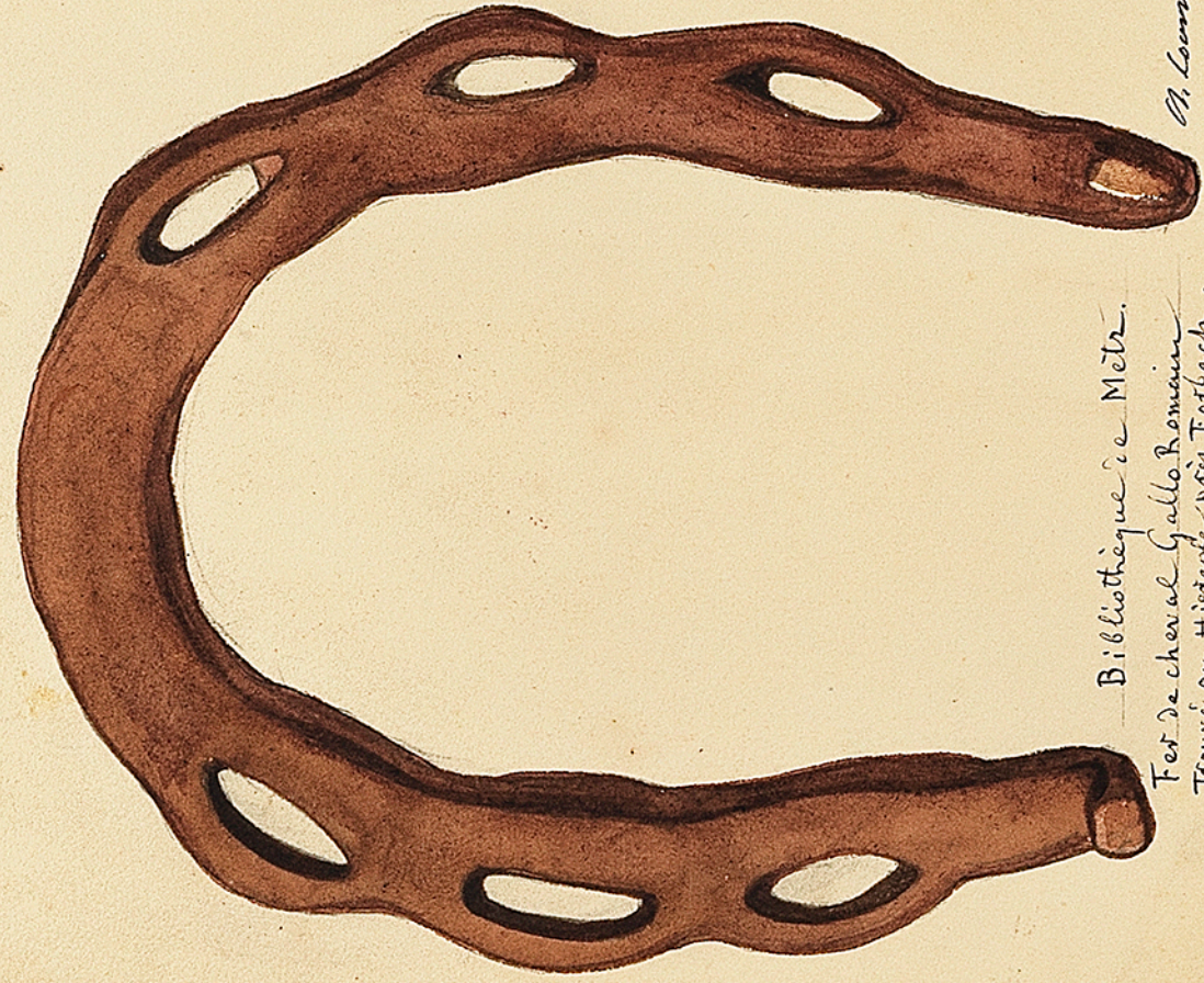
Bibliothèque de Metz. Fer de cheval Gallo-Romain Trouvé au Hiespach près Forbach.