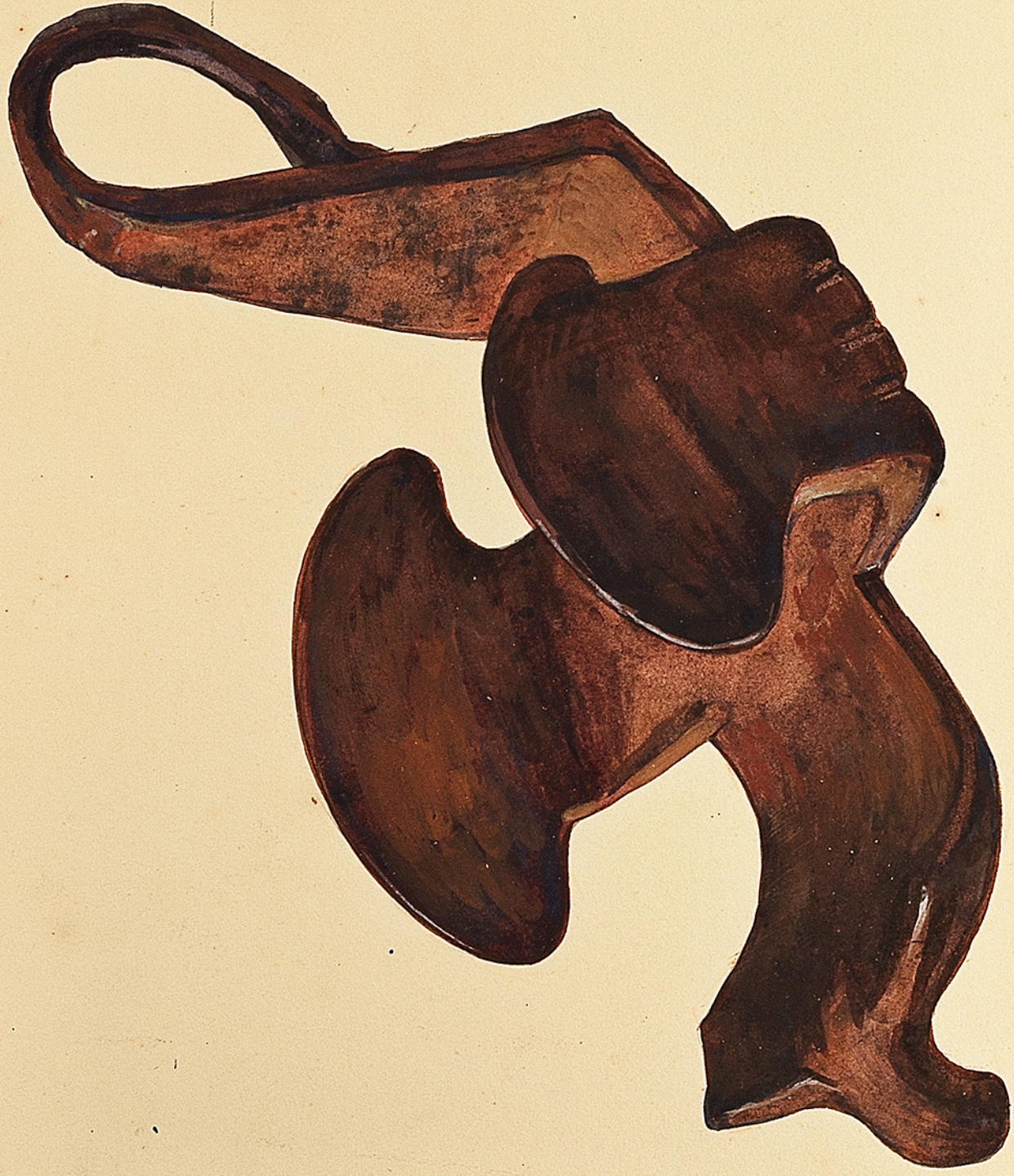
Musée historique Lorrain à Nancy. Sabot de cheval en fer, qui s'adaptait à la jambe au moyen de courroies. La face qui posait à terre est villosité de rainures profondes destinées à retoucher le pied du cheval. Ces sabots ont été communs dans l'Est de la France. Ch. Courmont