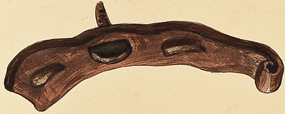
M r Pesson à Gray. Fer de cheval Trouvé à Mantoché (Gallo-Romain). dans un tombeau. Ch. Courmont