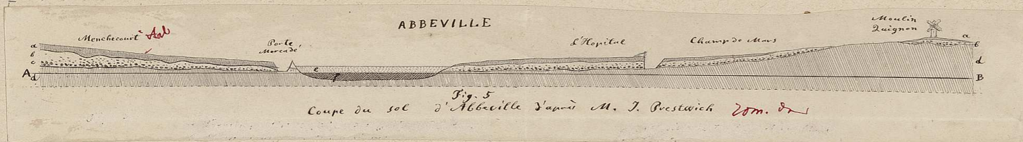
Planche du Dictionnaire des Gaulois Epoque celtique.