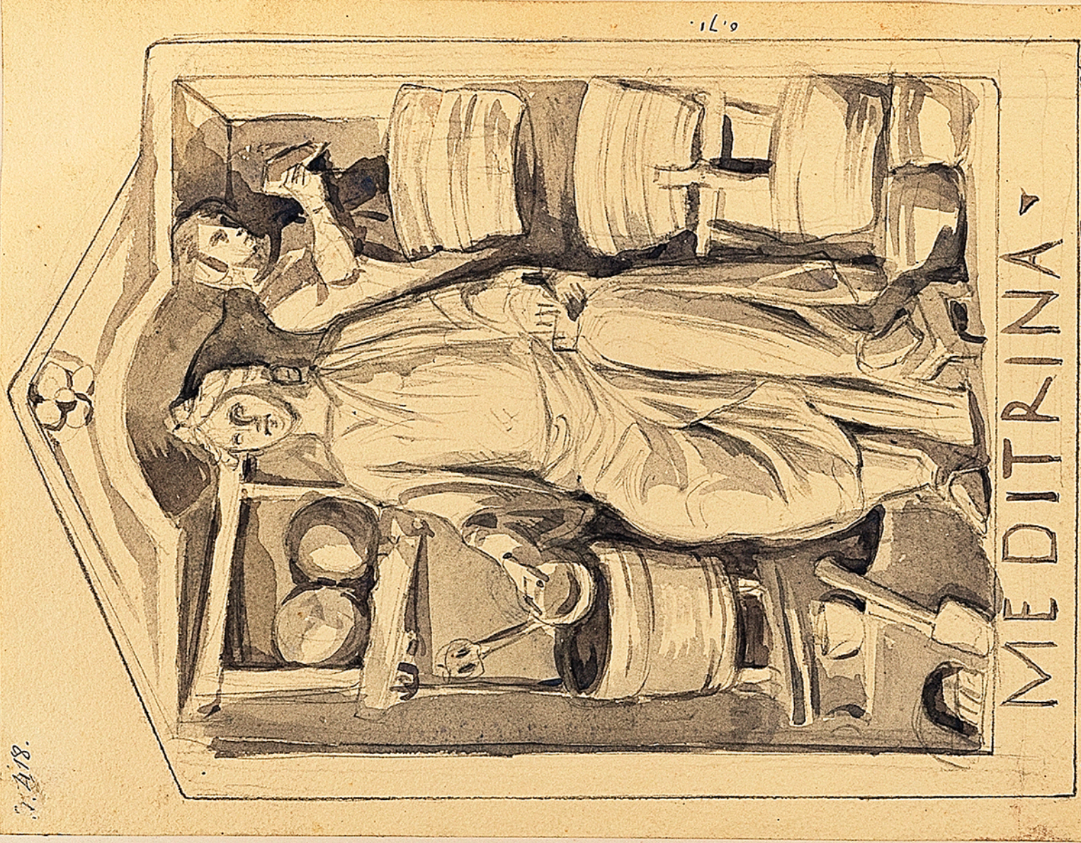
Musee d'Espinal. Meditrina, déesse des médecins et des pharmaciens. Bas-relief en pierre. Trouvé à Grand. La vierge tient d'une main une perle et de l'autre un tablier.