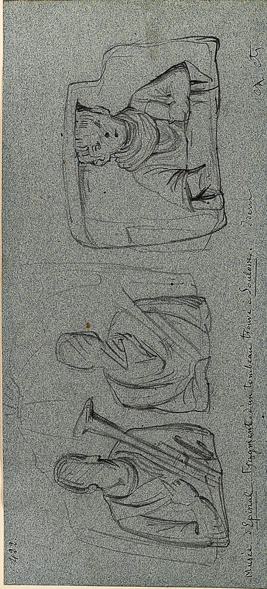
Musée d'Épinal. Fragment d'un tombeau trouvé à Soulosse.