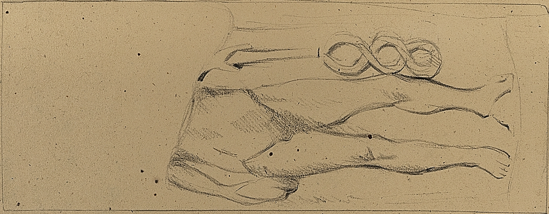
Musee de Gaubois. Musée d'Epinal. Bas-relief sculpte sur les rochers de Donon. Grès rouge.