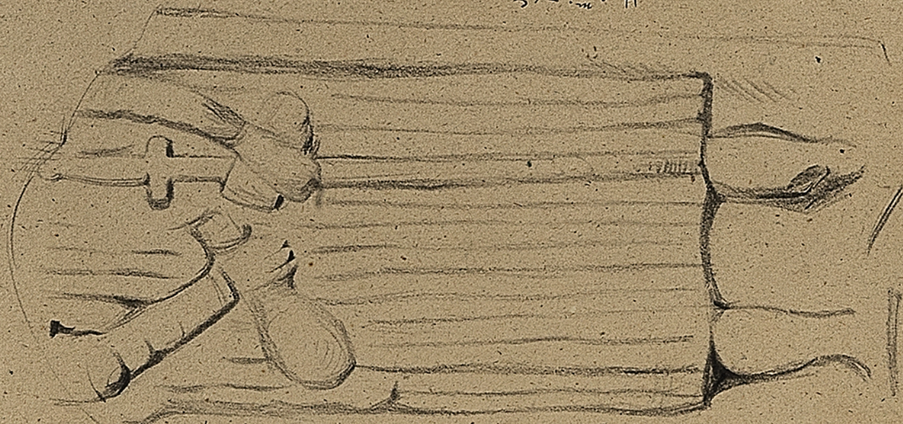
Musee d'Epinal. Personnage Gaulois. L. 0.30 Bas-relief sculpte sur les rochers de Donon. Grès rouge.