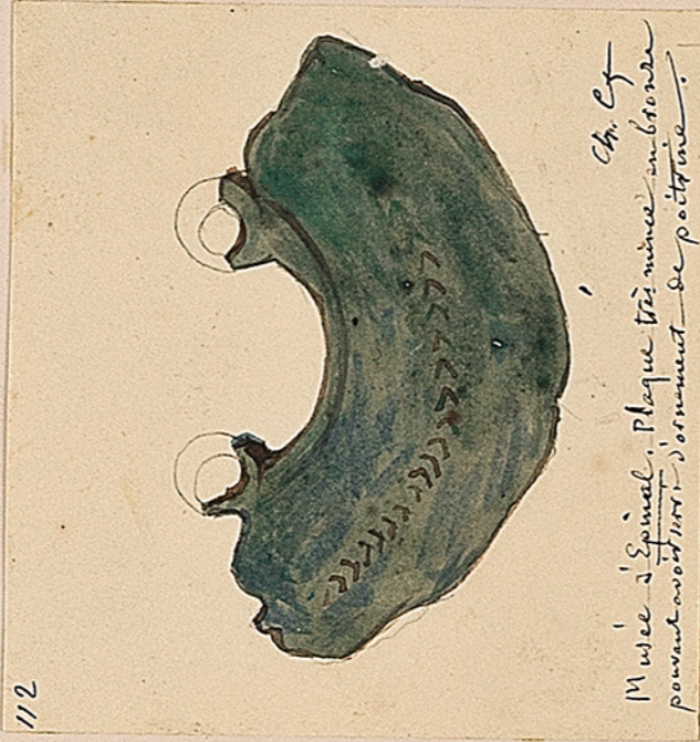
Musée d'Espinal. Plaque trépanée en bronze peut-être pour servir de protection. Ch. Cf.