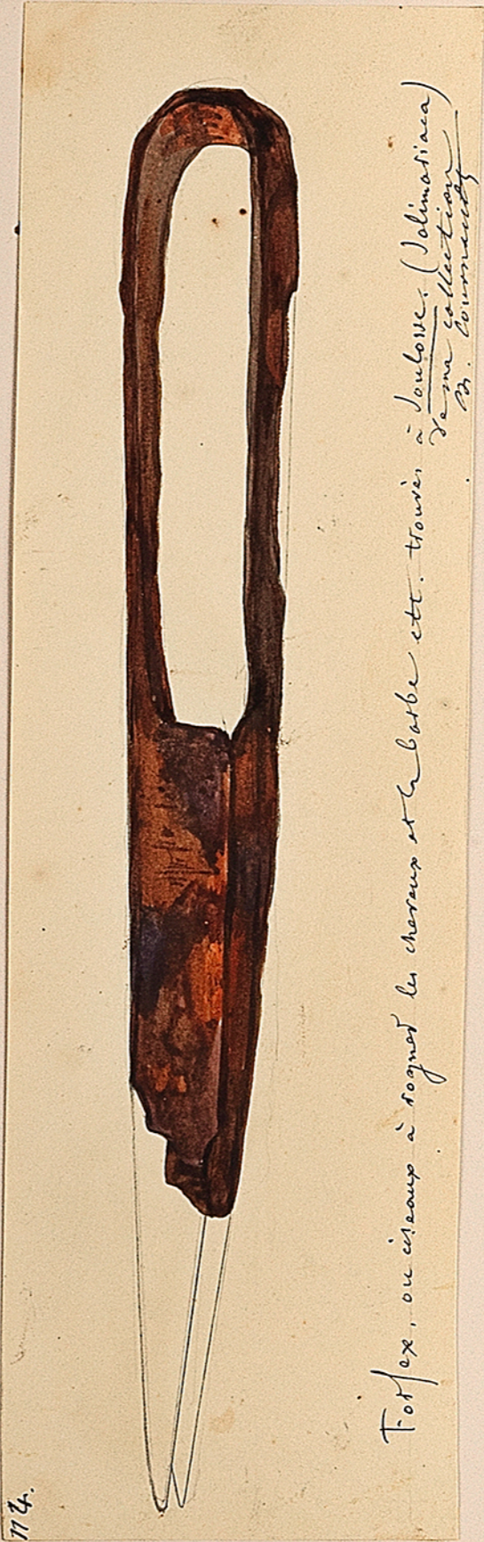
Toffex, ou ciseau à rogner les cornes et la barbe etc. Trouvé à Soulosse (Jolimarica) de ma collection B. Courmoult.