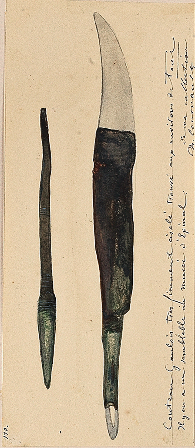
Couteau gaulois très finement ciselé. Trouvé aux environs de Toul. Il y en a un semblable au musée d'Espinal. B. Courmoult.