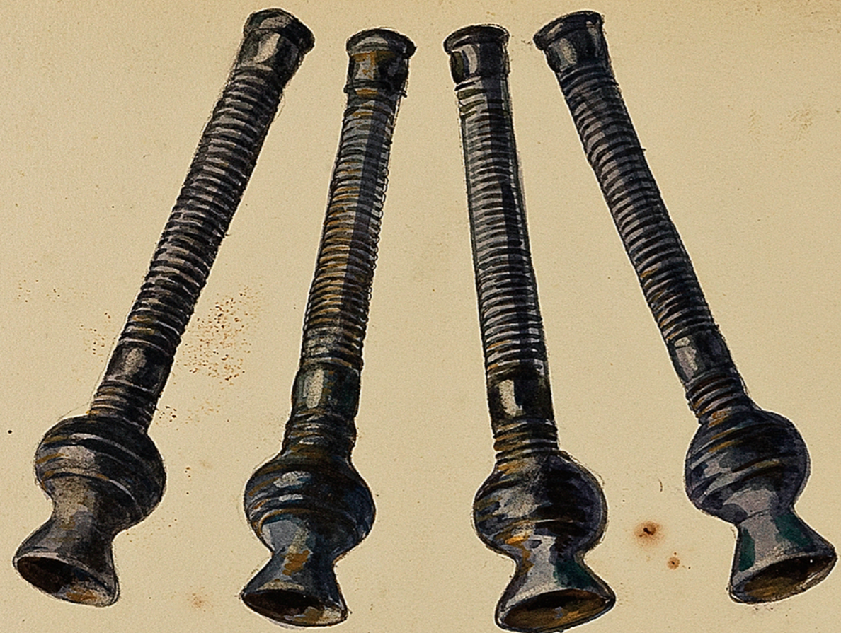
Bibliothèque de Nancy. Tubes de bronze ayant pu servir à garnir l'extrémité des lanières d'un fouet (?)