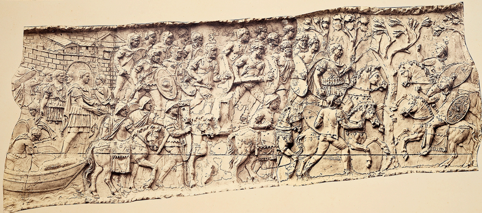
Numéros d'ordre et numéros des clichés.

IX (F. 57-61). Suite des préparatifs de départ. L'empereur harangue ses troupes. Un navire à deux rangs de rameurs précède un transport chargé de chevaux. Trajan s'embarque dans une barque qu'il gouverne lui-même, adossé à une sorte de pavillon. — Il harangue de nouveau l'armée sur le rivage et s'avance dans l'intérieur du pays. — Il charge au galop, à la tête de ses troupes. Deux cavaliers romains, sans doute des éclaireurs, viennent à sa rencontre.